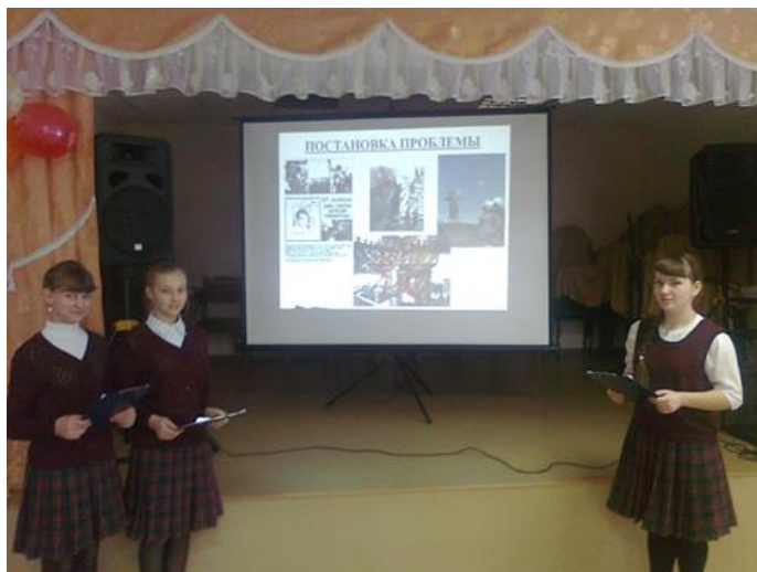
На фото: общешкольный классный час «Мы помним! Мы гордимся!»

«В 41-ом году упали первые бомбы. Началась жестокая война. Она длилась не месяц и не два, война растянулась на годы. Важно отметить то, что провинциальный город Куйбышев в октябре 1941 года приказом Госкомитета обороны был назначен «запасной» столицей Советского Союза. Это была особая миссия, и она была выполнена. А 7 ноября 1941 года в Куйбышеве, вместе с Москвой и Воронежем, состоялся военный парад. Сегодня мы почтим память павших в годы Великой Отечественной войны, вспомним Парад Победы в городе Куйбышеве и поздравим с победой всех живых!» - этими словами начался общешкольный классный час для старшеклассников.